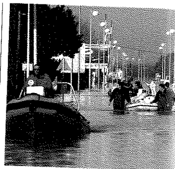
Le coût d'une crue centennale serait l'équivalent du plan de relance.

...de prévention. L'Association des maires de France souligne que « à la lecture des textes de transposition de la directive, nous avons constaté que l'approche choisie n'est pas suffisamment fondée sur la maîtrise de l'urbanisme et se limite à la gestion de l'eau par les comités de bassins ». Et les associations d'en appeler à une stratégie nationale de préven-