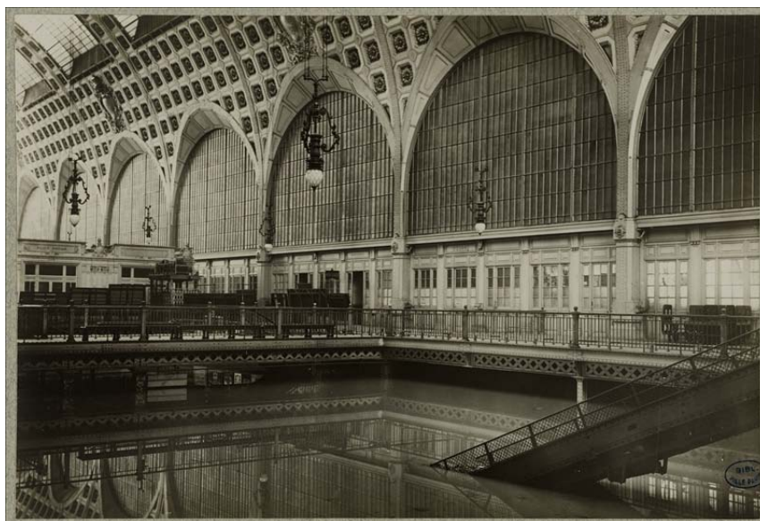
Le grand hall de la gare d'Orsay. Paris (VII e arr.), 1910.

Au cours du XX e siècle, afin de réguler le débit des fleuves, des barrages-réservoirs seront établis en amont de la région parisienne, sur l'Yonne (1950), la Seine (1966), la Marne (1974), l'Aube (1991). Le système d'annonce des crues, constitué d'une centaine de stations, est renforcé. Des plans de prévention de risques d'inondation (PPRI) sont élaborés. On sait cependant que Paris et la région parisienne peuvent demeurer vulnérables aux crues exceptionnelles telles que celle de 1910.