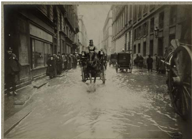
Voiture dans laquelle se trouve un ministre se rendant au ministère. Paris, 1910.

Le transport fluvial des voyageurs, alors très actif, est lui aussi interrompu.