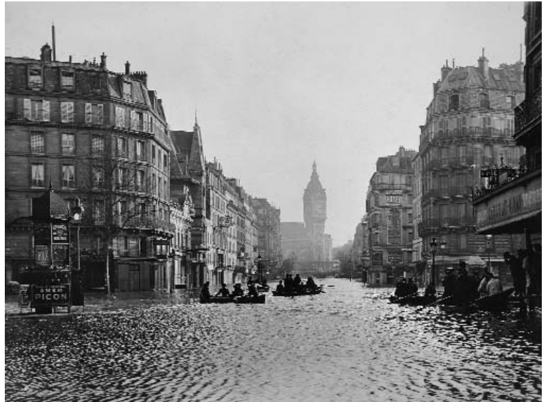
La rue de Lyon, janvier 1910

Les quatre statues de soldats (zouave, grenadier, chasseur, artilleur), de 6 mètres de haut, accolées aux piles du pont de l'Alma construit en 1856, constituent la référence populaire des Parisiens pour mesurer visuellement la montée de la Seine. En 1974, ce pont de pierre sera remplacé par un ouvrage métallique et seule la statue du zouave sera conservée.