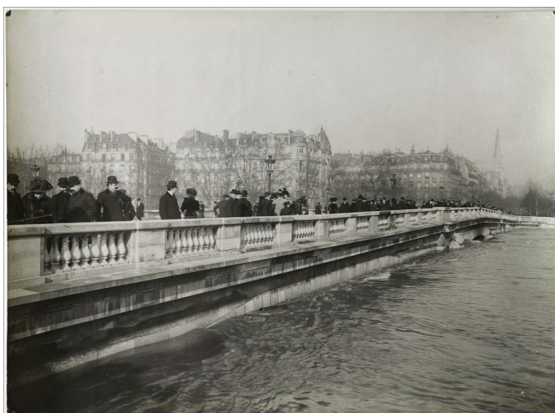
Le pont de l'Alma. Paris, 30 janvier 1910.

TOUTES LES PHOTOGRAPHIES DE CE DOSSIER DE PRESSE SONT DISPONIBLES POUR LA PRESSE ET LIBRES DE DROITS.