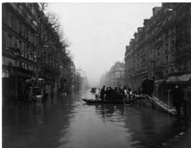
La rue de Lyon. Paris, janvier 1910.

raison de l'inondation, Chantecler sera un échec critique et la dernière pièce de Rostand.