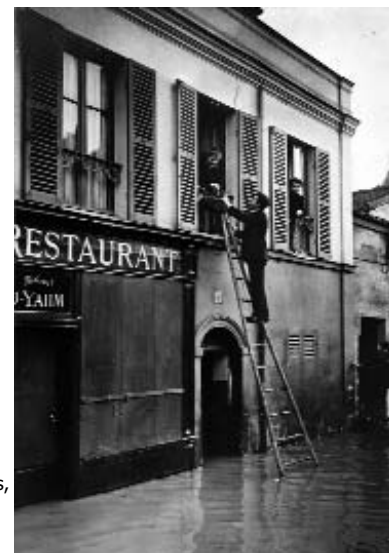
On apporte des provisions aux personnes des quartiers inondés. Paris, 1910.

Les sociétés caritatives se mobilisent rapidement. Trois associations de femmes de la haute société, sous le patronage de la Croix Rouge, la Société française de secours aux blessés militaires, l'association des Dames françaises, l'Union des Femmes de France, sont particulièrement actives. Des asiles pour accueillir les sinistrés sont ouverts dans les quartiers touchés, comme au Séminaire de Saint-Sulpice ou aux Invalides. Cinq ans plus tard, l'expérience acquise contribuera à l'efficacité des secours lors de la Grande guerre.