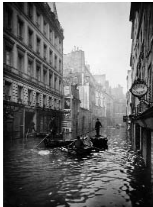
La rue de Seine. Paris (VIIe arr.), 29 janvier 1910.

Un formidable élan de solidarité se fait jour, dans toute la France comme à l'étranger, et des souscriptions, des soupes populaires et des asiles apportent leur soutien aux victimes. Sans susciter de crise majeure ni de remise en cause des pouvoirs publics, l'inondation gagne le débat politique, de Jean Jaurès au courant catholique. Après le 28 janvier 1910, s'amorce la décrue. L'heure est à la désinfection, à la lutte, qui s'avèrera efficace, contre les risques d'épidémie, aux réparations, à la remise en marche des transports et des services, qui prendra parfois plusieurs mois. C'est également l'heure du bilan des dégâts, chiffrés à 400 millions de francs-or, et presque aussitôt celle des leçons à tirer pour l'avenir.