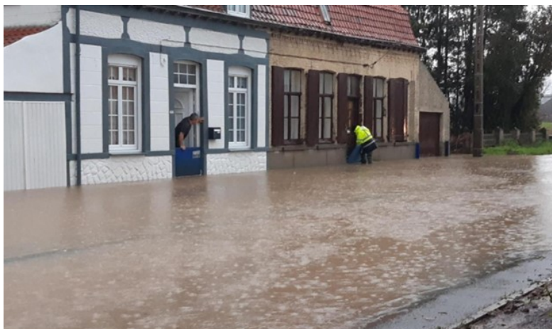
Mobilisation de la Réserve Communale de Sécurité Civile de Saint-Jans-Cappel pour aider les habitants à installer des batardeaux – 5 mars 2020

Le SYMSAGEL sensibilise également les équipes municipales aux dispositifs existants permettant d'anticiper les inondations tels que la prévision et la vigilance météorologiques de Météo France, la vigilance crues réalisées sur les bassins de la Lys et de ses principaux affluents par le Service de Prévision des Crues (SPC) Artois-Picardie, les outils « Avertissements Pluies Intenses à l'échelle Communale (APIC) et, le cas échéant, « Vigicrues Flash », ou encore les système d'avertissements locaux aux crues (SDAL) mis en place par le SYMSAGEL lorsque la commune est concernée.