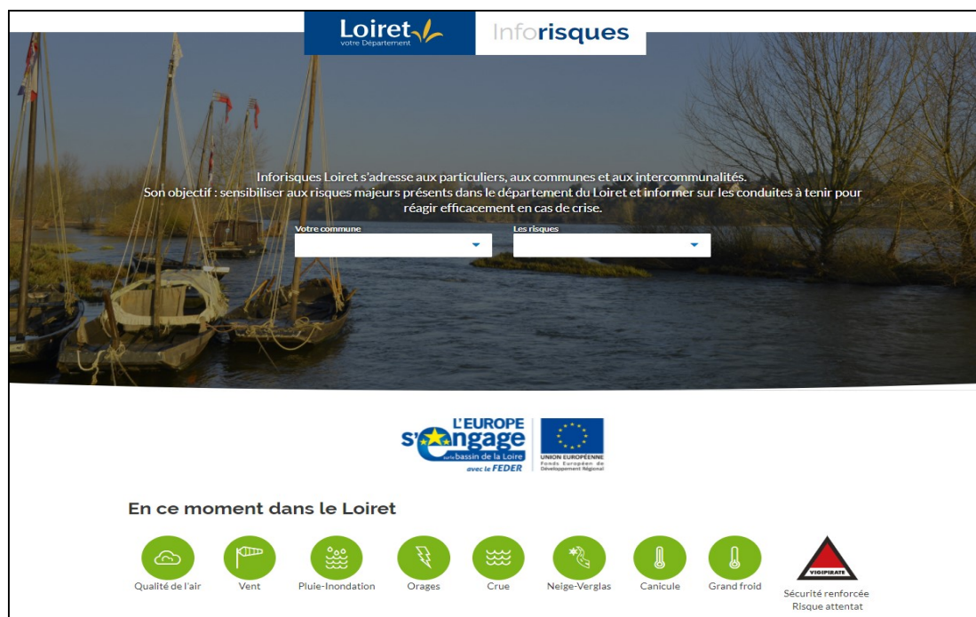
Page d'accueil de la plate-forme « Inforisques Loiret »

A partir de 2017, le Département du Loiret a développé une plate-forme internet « Inforisques Loiret » destinée, d'une part, à informer les Loiretains sur l'ensemble des risques auxquels leur commune est exposée, et d'autre part à proposer aux communes un accompagnement en matière de préparation à la gestion de crise.